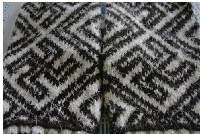
Илл. 15. Мужская рукавица из коллекции Лии Калиничны Титовой. Июль 2009 г. Деревня Защелье Мезенского района Архангельской области

Паттерны согласованной реальности: полихромное вязание (И. Веселова)