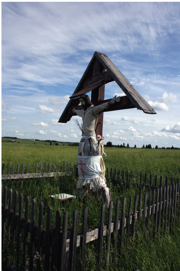
Илл. 6. Обетный крест между деревнями Жердь и Петрова. Июль 2007 г. Мезенский район Архангельской области