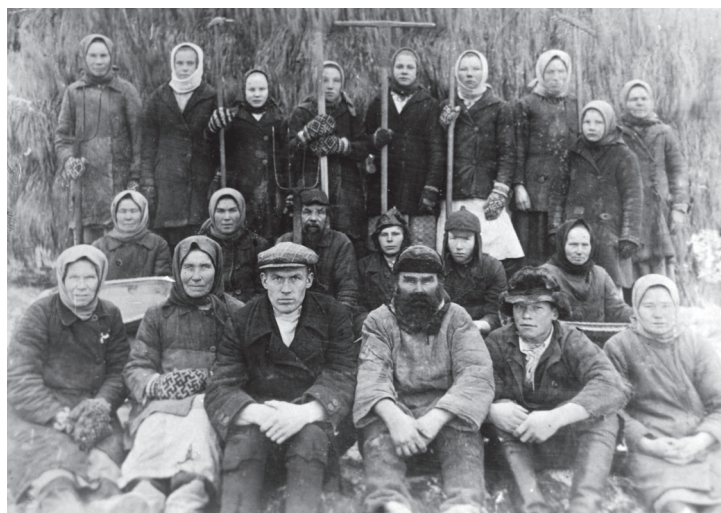
Илл. 11. Сенокосная бригада. 1950-е – 1960-е гг. Многие в рукавицах. Из коллекции деревенского музея «Дом деда Мартына». Переснято И. Веселовой. 2009 г. Деревня Селище Лешуконского района Архангельской области