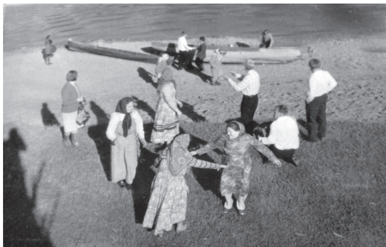
Илл. 21. Кадриль на берегу реки Мезень. Июль 2013 г. Деревня Засулье Лешуконского района Архангельской области