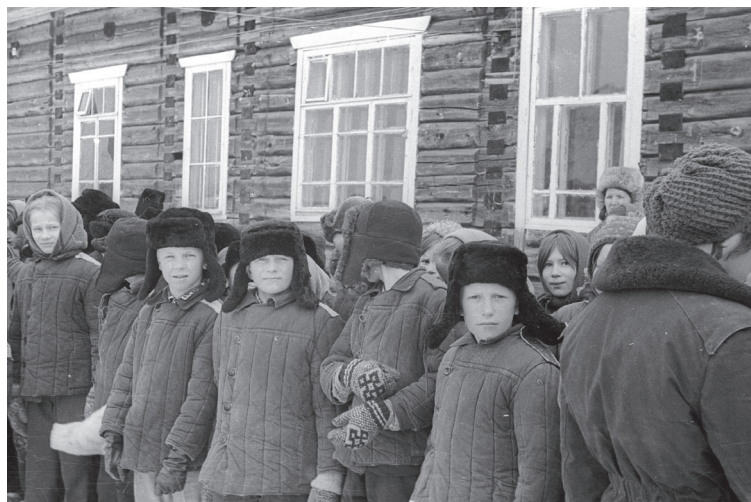
Илл. 3. Школьная линейка перед выходом в зимний поход. Дети в узорных рукавицах. 1970-е гг. Село Вожгора Лешуконского района Архангельской области

Паттерны согласованной реальности: полихромное вязание (И. Веселова)