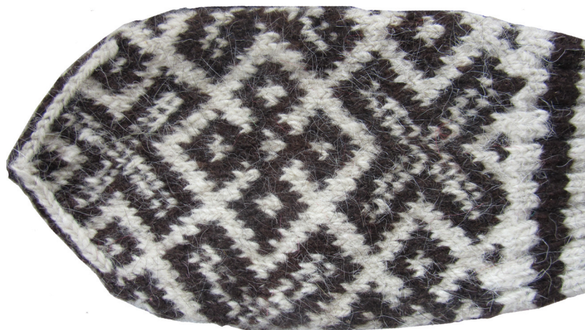
Илл. 17. Симметричность старинного узора рукавицы относительно вертикальной оси. Мужская рукавица из коллекции Иды Васильевны Коршаковой (1953 г. р., урж. д. Елкино). Июль 2015 г. Деревня Бычье Мезенского района Архангельской области.

Паттерны согласованной реальности: полихромное вязание (И. Веселова)