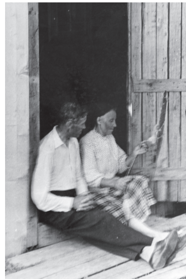
Илл. 23. Женщина прядет, сидя на крыльце, рядом сидит мужчина. Фотография из альбома деревенской жительницы. Переснято Д. Сытниковой. Июль 2009 г. Деревня Селище Лешуконского района Архангельской области