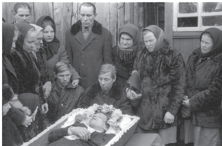
Илл. 2. Деревенские похороны. Старшие женщины в узорных рукавицах 1970-е гг. Село Вожгора Лешуконского района Архангельской области

Паттерны согласованной реальности: полихромное вязание (И. Веселова)